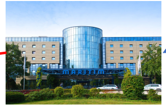
R(h)ine&Dine / Get Together Maritim Hotel Bonn Kurt-Georg-Kiesinger-Allee 1 53175 Bonn