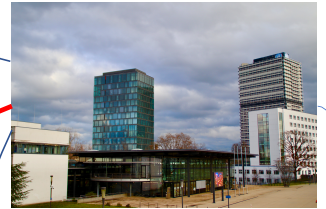
Kongress Plenarsaal im WCCB Platz der Vereinten Nationen 53113 Bonn