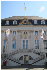
Stadtführung Marktplatz Bonn

Schiffahrt Brassertufer "Alter Zoll" 53111 Bonn